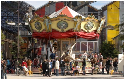
Manèges Andréa et Catimini sur l'île de Nantes

Un équipement ludique à très forte image (de type création de la troupe nantaise Royal de luxe) perpétuant de façon quasi permanente la dimension festive de l'Esplanade.