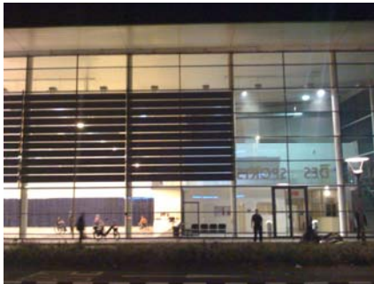
Halle des sports, bd Vivier Merle, Lyon

Besoins à analyser avec la Direction des Sports.