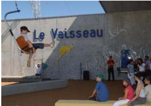
Cité des sciences « le Vaisseau » à Strasbourg

Les études réalisées par le passé par la Métro paraissent être non disponible en cette fin d'année 2009.